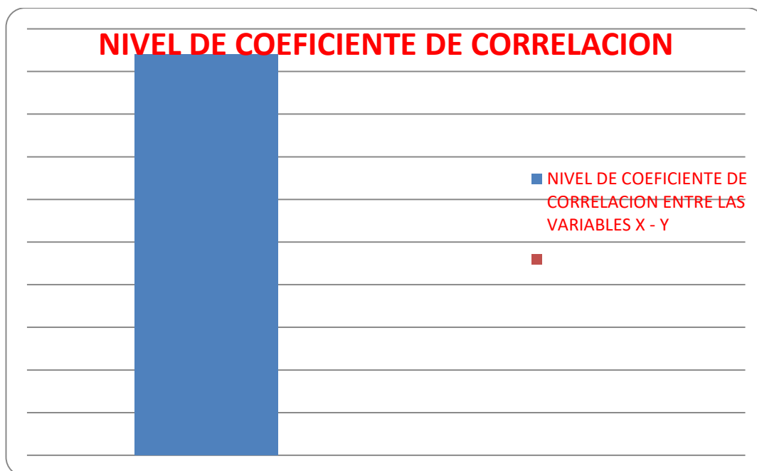
GRÁFICO Nº 5

Como se puede advertir en la presente tabla y gráfico, el Coeficiente de Correlación alcanza un valor de r = 0.83\% positivo, que puede variar desde -1 hasta 1. No existe relación entre variables cuando el coeficiente es 0.