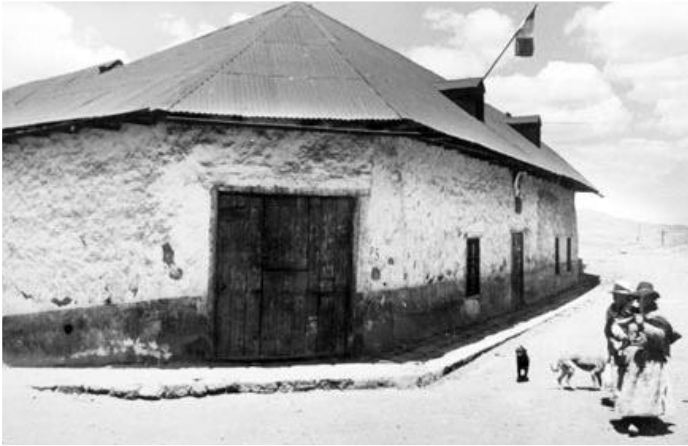
La antigua casa de Daniel Alcides Carrión, ubicada entre las calles Ijurra y Huánuco, desapareció como consecuencia del avance del Tajo abierto.

Además, la declaración oficial del bien arquitectónico como patrimonio monumental