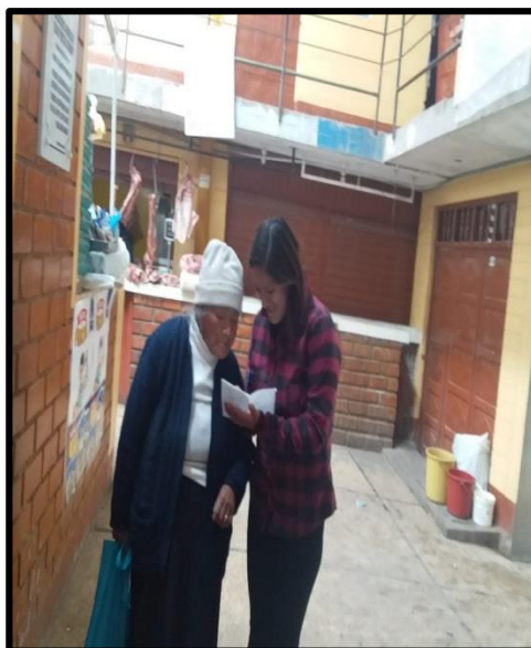
Fotografía N°6: Encuesta a los Compradores referente a la reducción del uso de bolsas plásticas y promoviendo el uso de otras alternativas como bolsas de tela, canastas, etc.