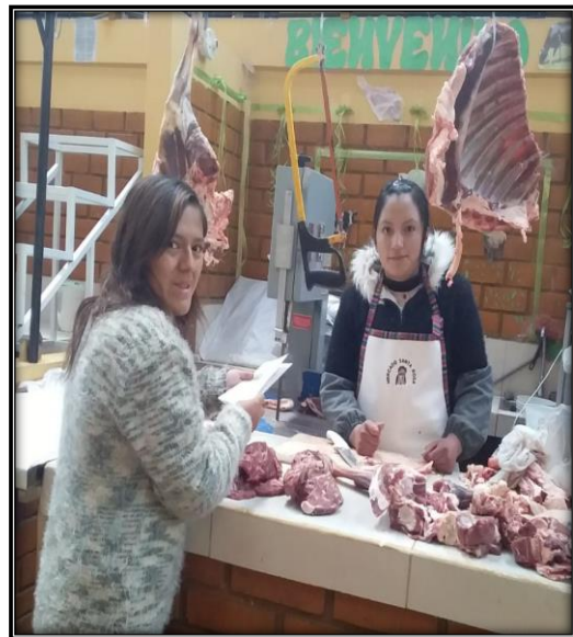
Fotografía N°7: Brindando información a los comerciantes a través de trípticos, folletos, afiches sobre las consecuencias del uso de bolsas plásticas.