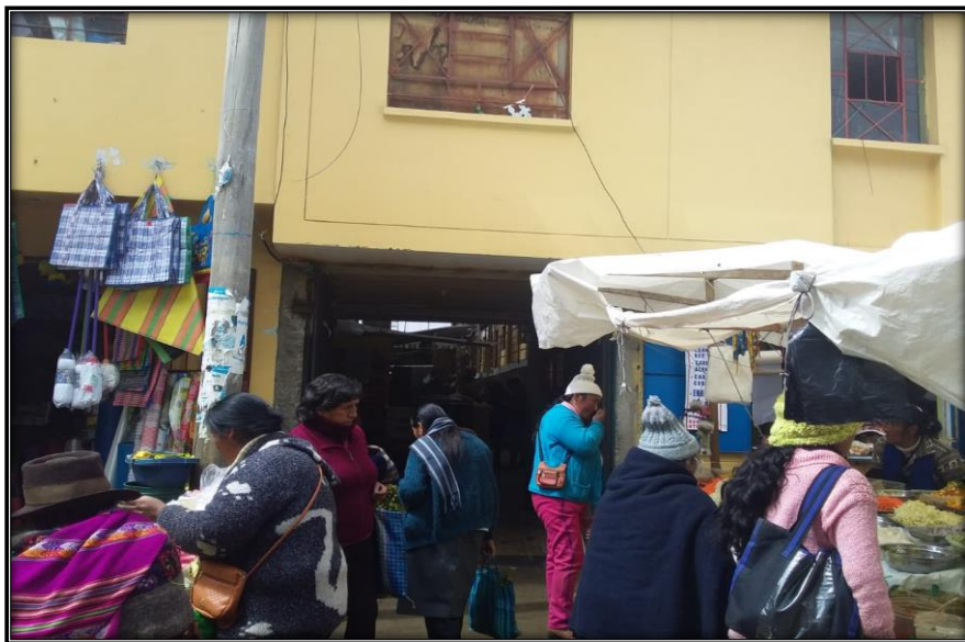
Fotografía N°4: Compradores y transeúntes en el Mercado Santa Rosa