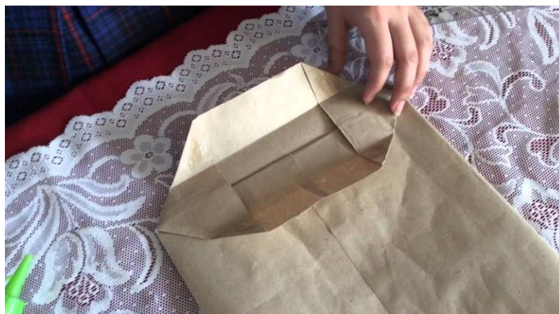
Procedimiento de elaborar bolsas de papel