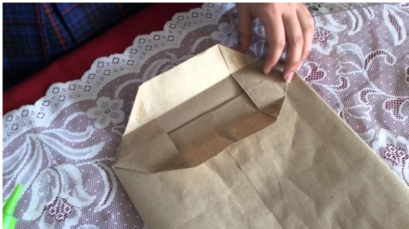
Procedimiento de elaborar bolsas de papel