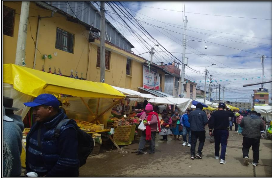
Fotografía N°1: Exterior del Mercado Santa Rosa –Yanacancha