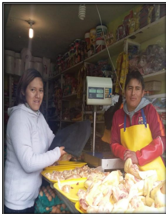
Fotografía N°9: Regalar bolsas de tela como estrategia de cambio a los comerciantes.