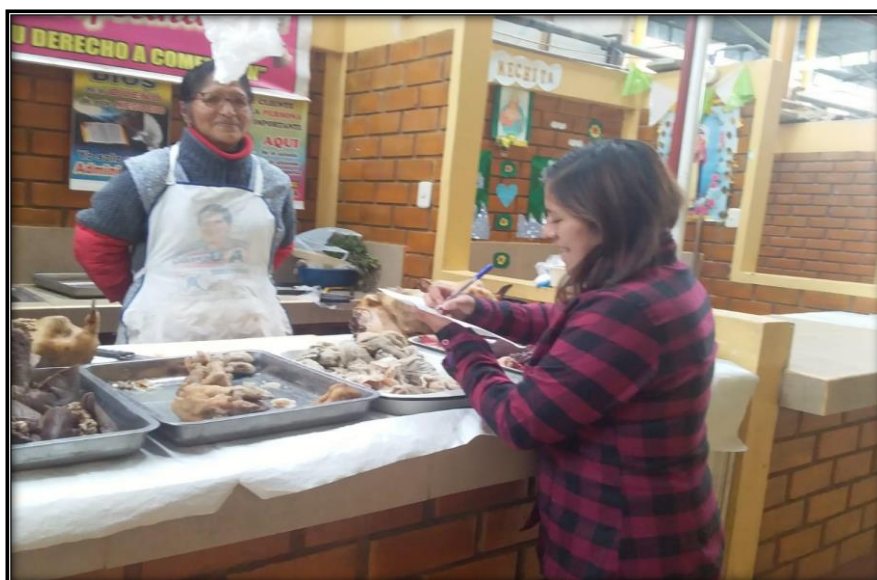
Fotografía N°5: Encuesta a los Comerciantes referente a la reducción del uso de bolsas plásticas y promoviendo el uso de otras alternativas como bolsas de tela, canastas, etc.