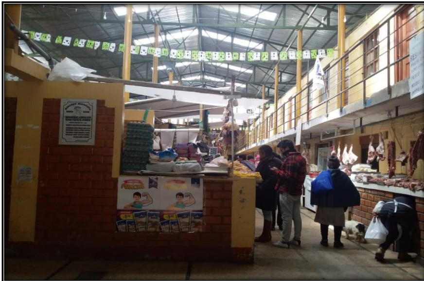
Fotografía N°2: Interior del Mercado Santa Rosa –Yanacancha