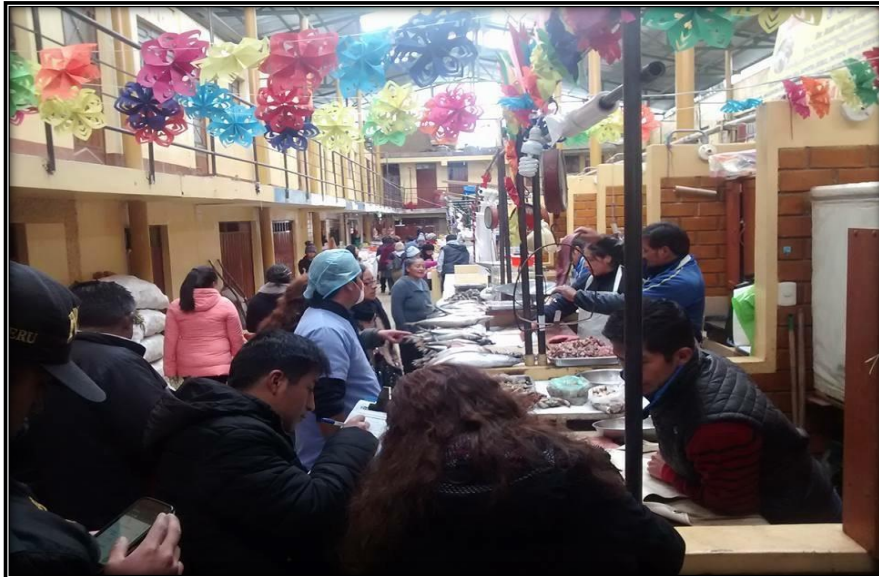
Fotografía N°3: Comerciantes del Mercado Santa Rosa