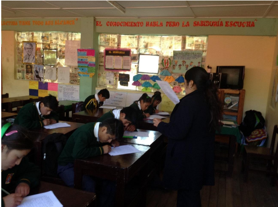
Desarrollo del trabajo de investigación.