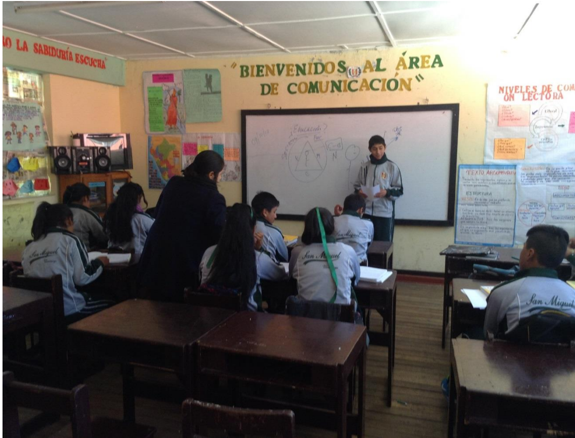
Proceso del trabajo de investigación