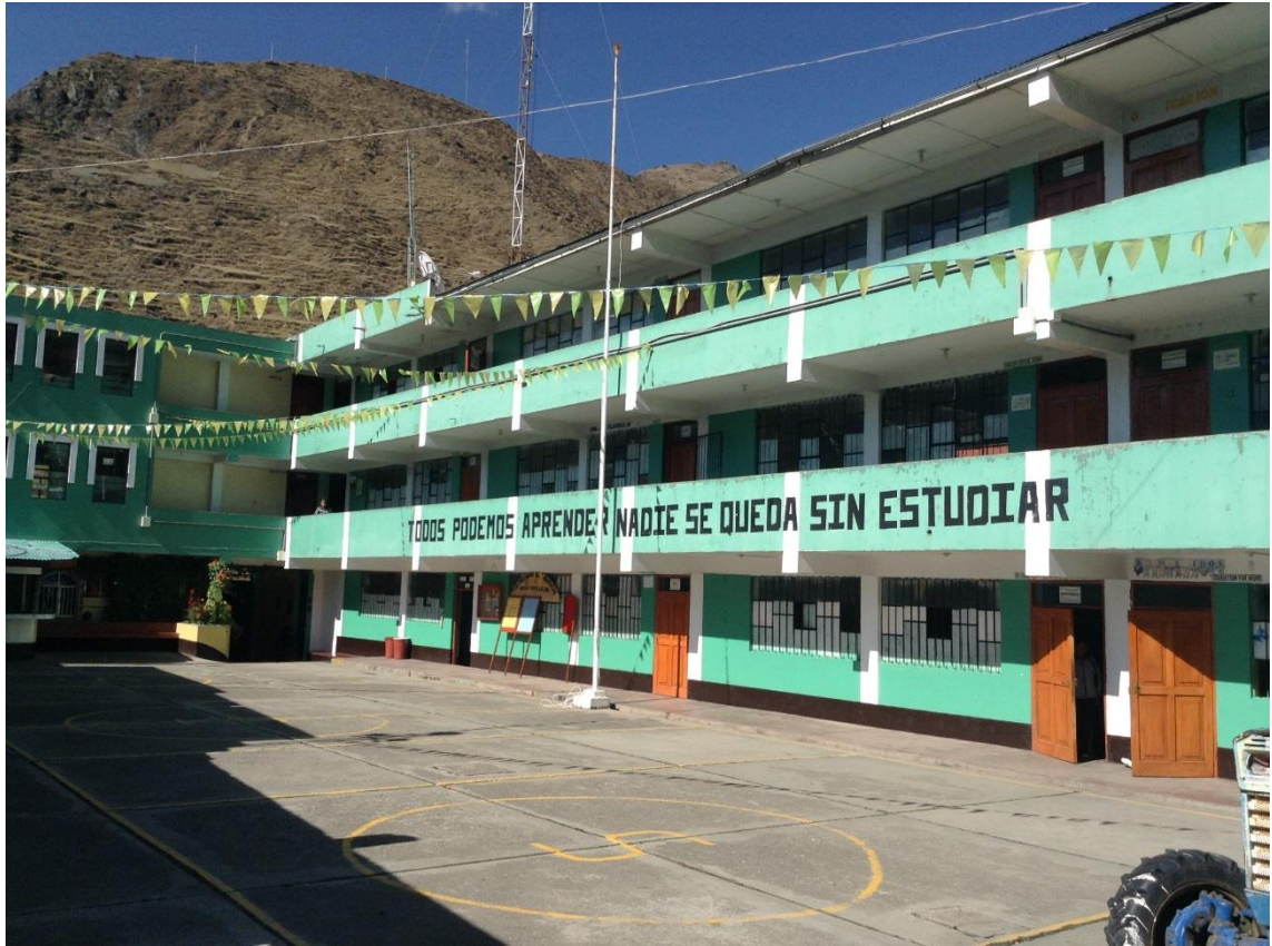
Salon de clases de la I. E. Agropecuario No. 114 del distrito de Ulcumayo, Junin