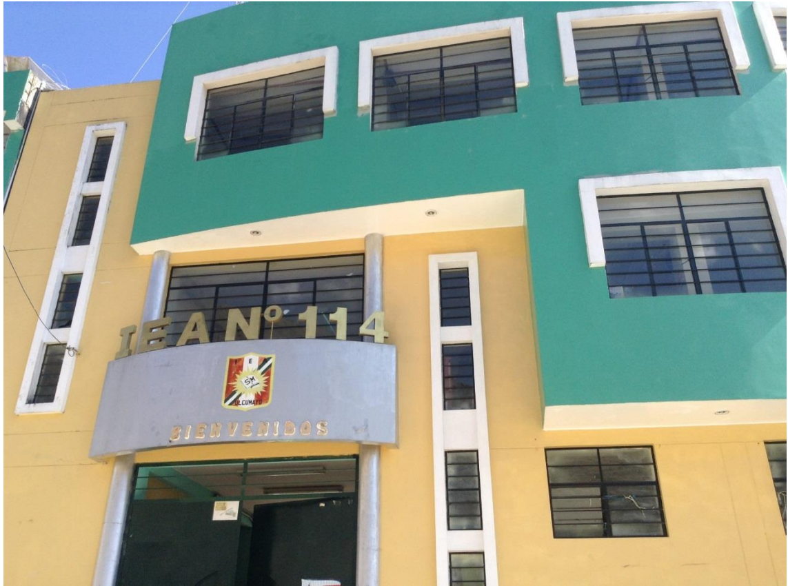
Institución Educativa Agropecuario No. 114 del distrito de Ulcumayo, provincia y región Junín