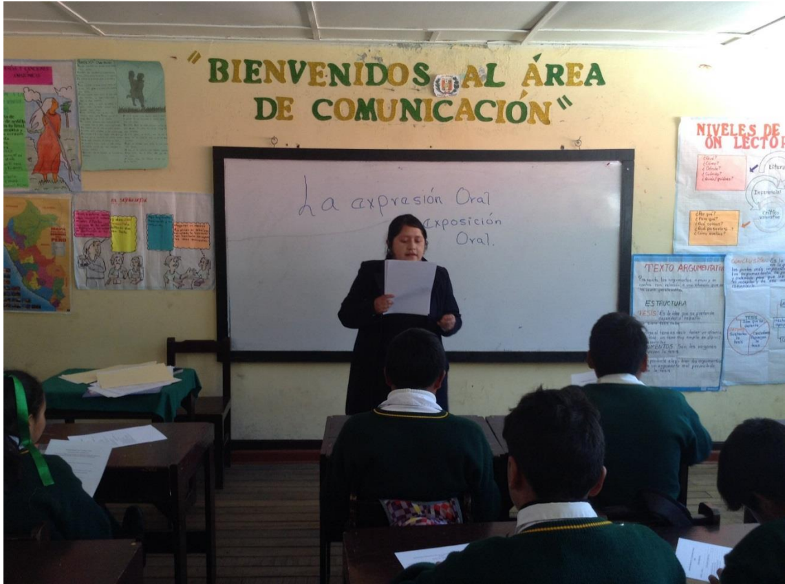
Reforzamiento por la investigadora.