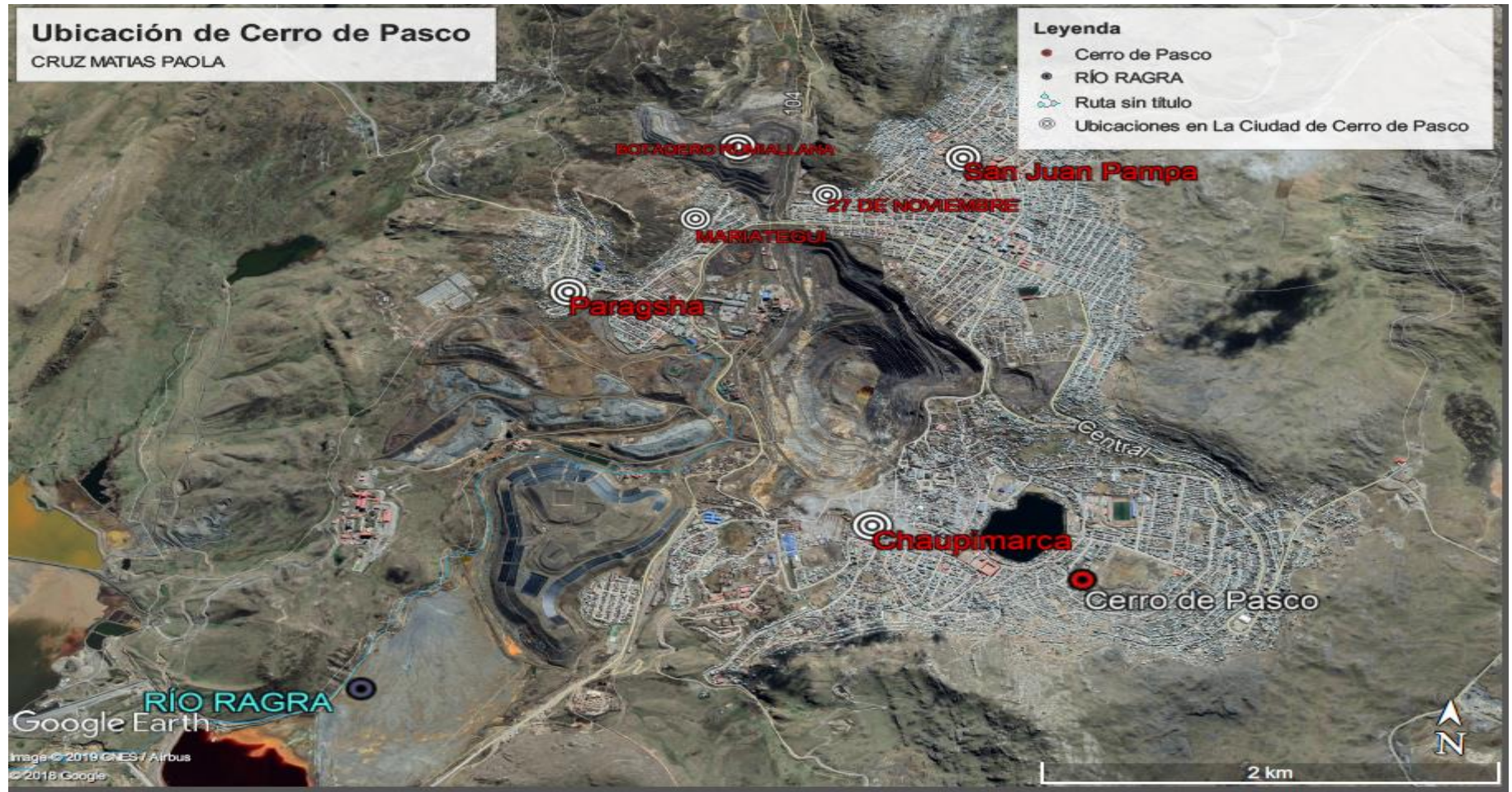
MAPA N° 1 Ubicación de la Ciudad de Cerro de Pasco