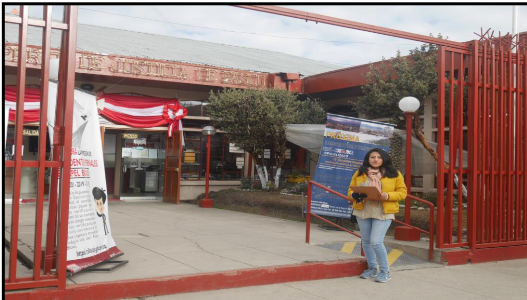
IMAGEN N° 1 Recopilación de Información-Poder Judicial Pasco

Para determinar los delitos ambientales producto a las actividades mineras en la ciudad de Cerro de Pasco se recolecto información del Poder Judicial-Pasco, información de la Municipalidad Provincial de Pasco, Municipalidad Distrital de Yanacancha, asimismo de las visitas a los distintos sectores de la ciudad de Cerro de Pasco y así mismo a los diversos componentes de la actividad minera específicamente de la empresa minera CERRO SAC, estas actividades realizadas podemos constatar en las imágenes N° 01, 02, 03, 04, 05 de la presente investigación.