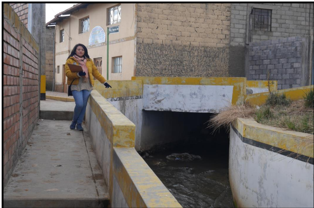
IMAGEN N° 7 Punto de Monitoreo P-1 Paragsha (Río Ragra)

realizó en estos dos puntos de monitoreo donde a simple vista se puede observar que las características del agua cambia drásticamente en el punto de monitoreo P-2 con respecto al punto de monitoreo P-1, tal como se puede observar en las imágenes N° Imagen N° 07 y 08 de la presente investigación y asimismo en el Anexo N° 02 se adjunta la copia del informe de ensayo extraído.