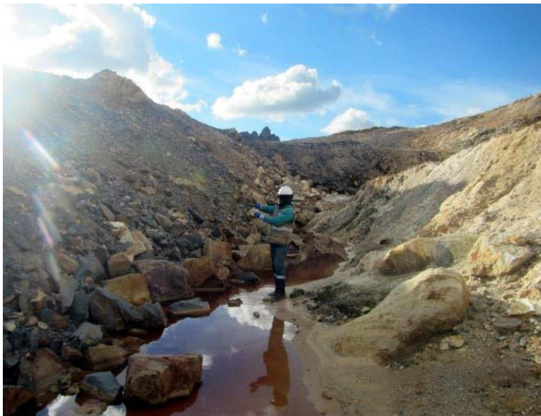
( https://www.oeфа.gob.pe/wp-content/uploads/2018/12/OEFA-3-1.jpg )