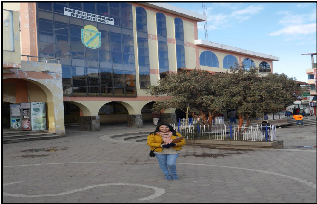
IMAGEN N° 3 Desmontera al fondo de la población de Paragsha