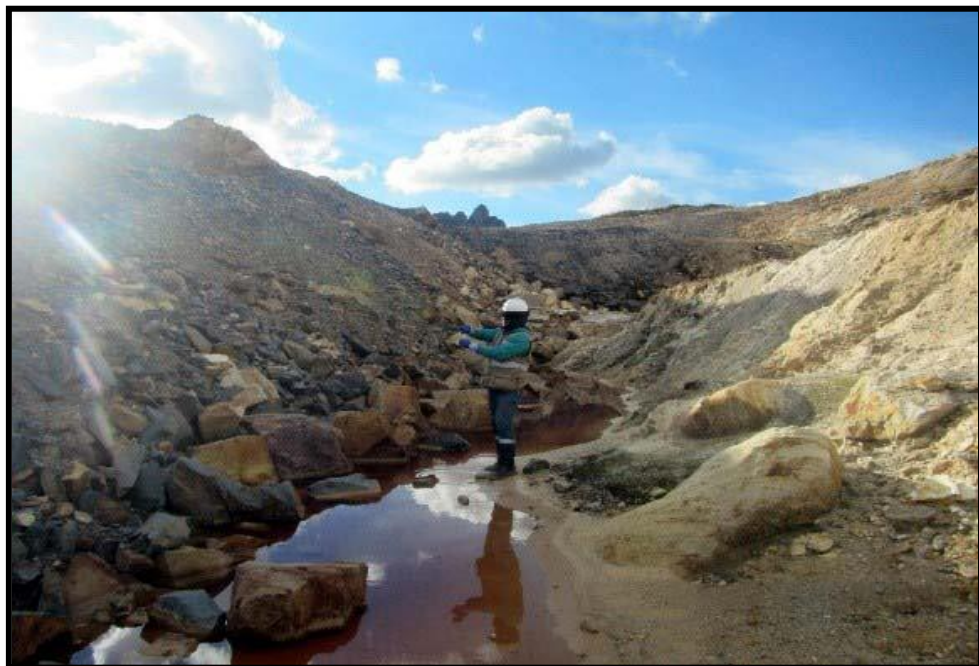
IMAGEN N° 9 Desmonte extraído del Tajo Raúl Rojas generando drenaje ácido en las pampas de Paragsha.

Como se puede evaluar la empresa minera CERRO SAC, se encuentra en proceso de obligación por la OEFA en eliminar este impacto ambiental al suelo por presencia de drenaje ácido producido por el desmonte extraído del Tajo Raúl Rojas generando drenaje ácido en las pampas de Paragsha, incumpliendo con el Código Penal en su artículo Art. 304, y estos se pudo corroborar en las imágenes N° Imagen N° 09 de la presente investigación y asimismo en el Anexo N° 3-C se adjunta esta publicación del organismo de fiscalización (OEFA).