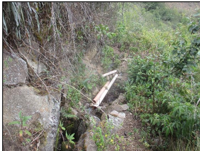
Figura 2: El canal artesanal aperturado por la población en el transcurso que recorre el agua se va infiltrando en el suelo que lo conduce, esto debido por contarse con una canal inadecuada y sin criterio técnico considerado por las normas del sector riego.