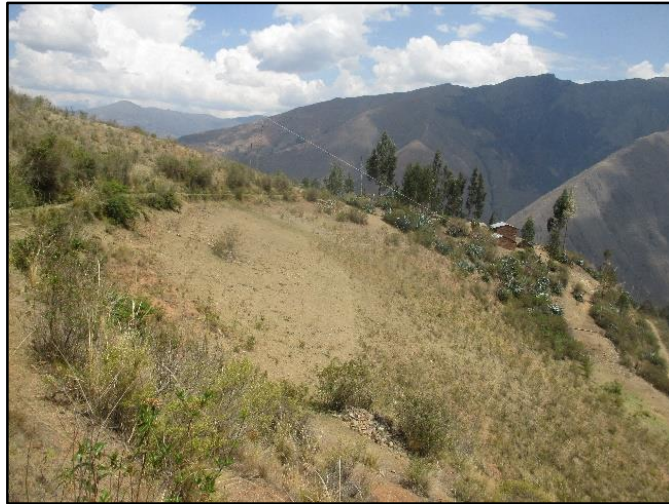
Figura 3: Esta obra tiene una antigüedad de aproximadamente 20 años que fueron construidos por la población mediante faenas realizadas cada fin de semana, para su apertura de un canal de riego, con la finalidad que puedan regar sus terrenos de sembrío.