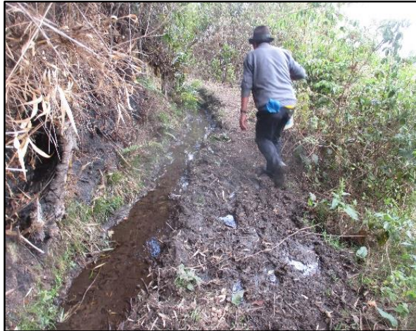
Figura 1: Según la fotografía se puede apreciar, que el trazo del canal de riego, está hecha por los mismos beneficiarios de forma artesanal.