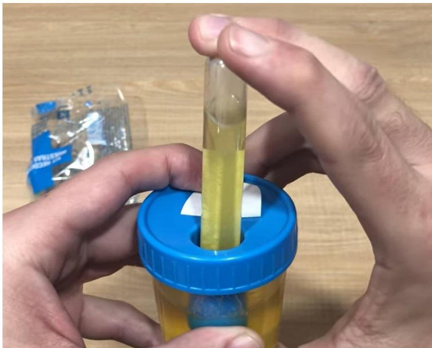
Figura 4: Muestra de orina por el personal de salud

Conocedores de la declaratoria de emergencia en el año 2018 en los Distritos de Chaupimarca, Simón Bolívar según el decreto supremo N°020-2017 - SA tras la problemática de la contaminación por exposición y afectación por metales pesados como el plomo cadmio mercurio y Arsénico la dirección Regional de salud Pasco realiza el monitoreo y la vigilancia sanitaria de la calidad del agua para consumo humano así como el aire y suelo, por lo que se solicitó los reportes del monitoreo realizado en el año 2019, con el fin de evaluar la exposición y tomar medidas para minimizar los riesgos para la salud pública.