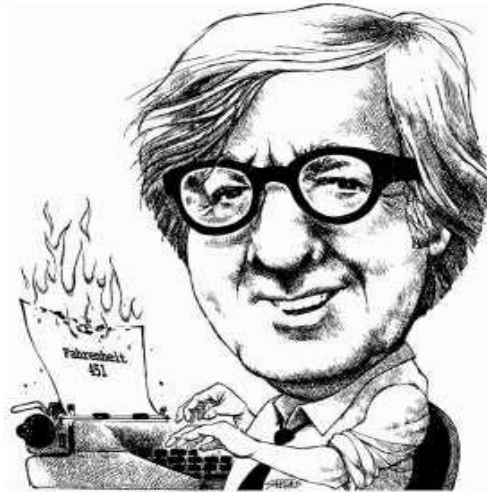
1. Caricatura de Ray Bradbury escribiendo Fahrenheit 451.

de Bradbury es una constante fascinación no solo para los lectores, sino también para los propios escritores. Lo que demuestra la calidad con que