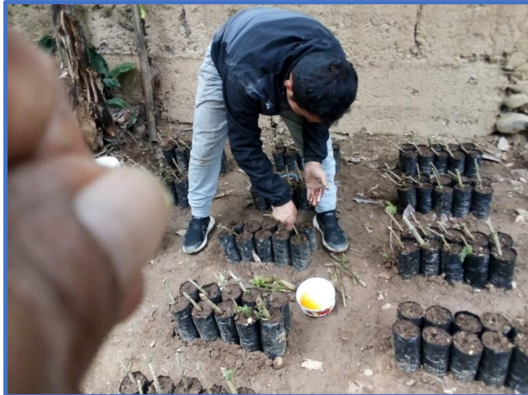
Embolsado de sustrato de estiércol de gallina y ubicación en tratamientos en el vivero.