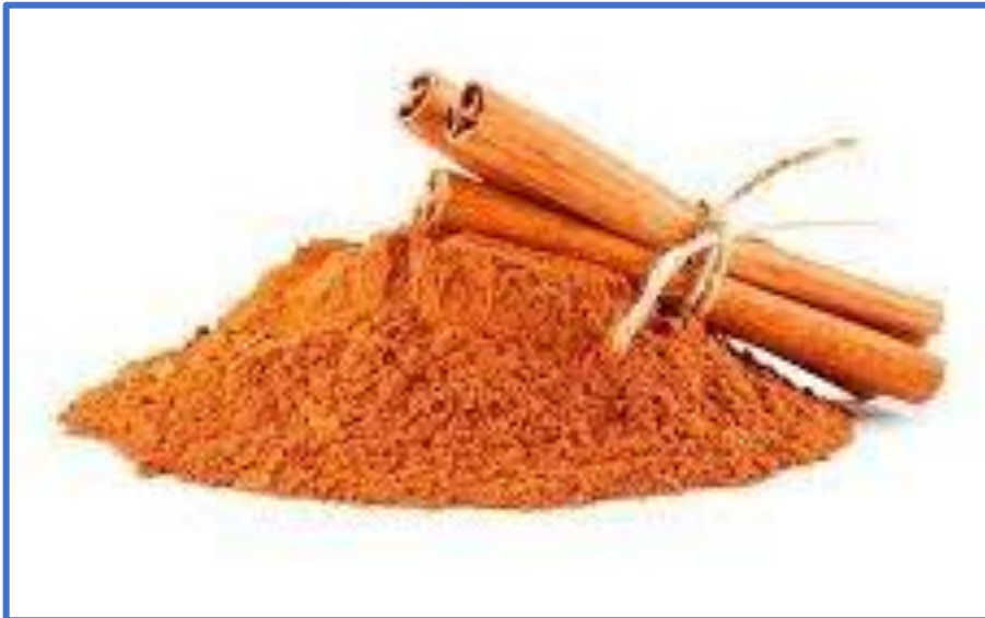
Árbol de cedrón y canela en polvo