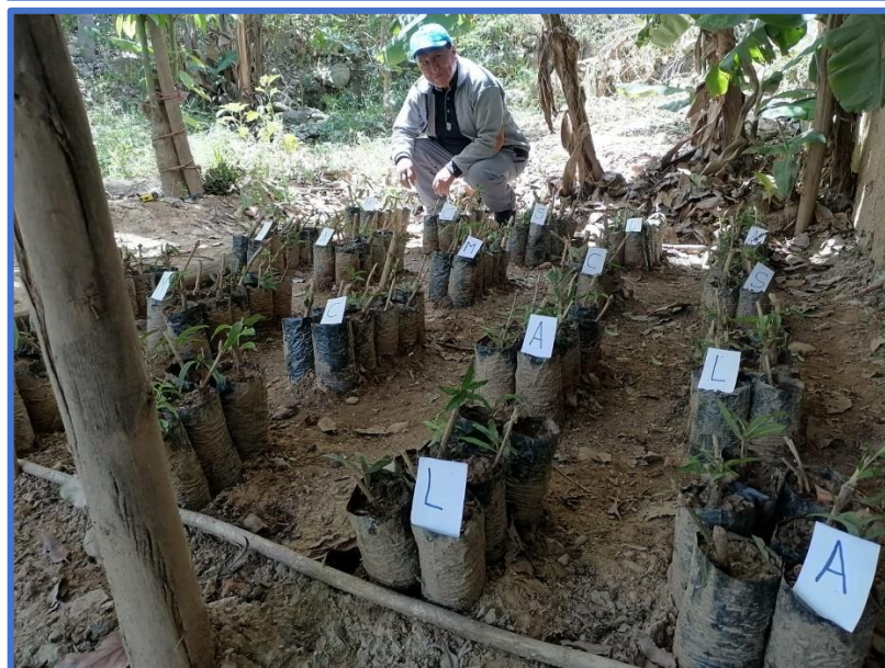
Evaluación de la parcela experimental identificado con los 5 tratamientos