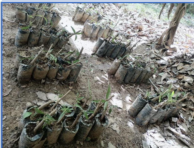
Ubicación y presentación de bolsas en el vivero con esquejes de cedrón