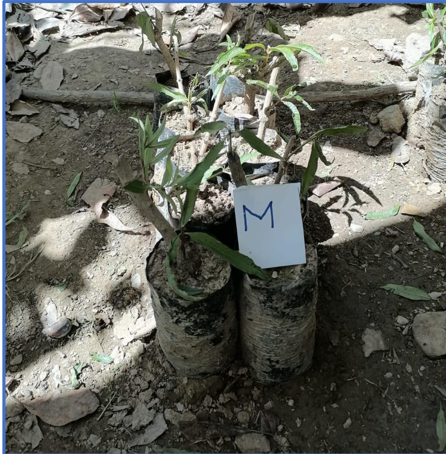
Muestra de planta que sobresalió con el regulador de crecimiento miel de abeja.