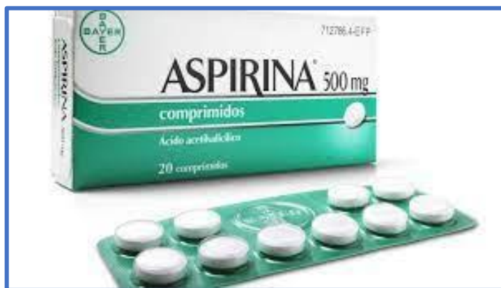
Lenteja, sábila y Aspirina