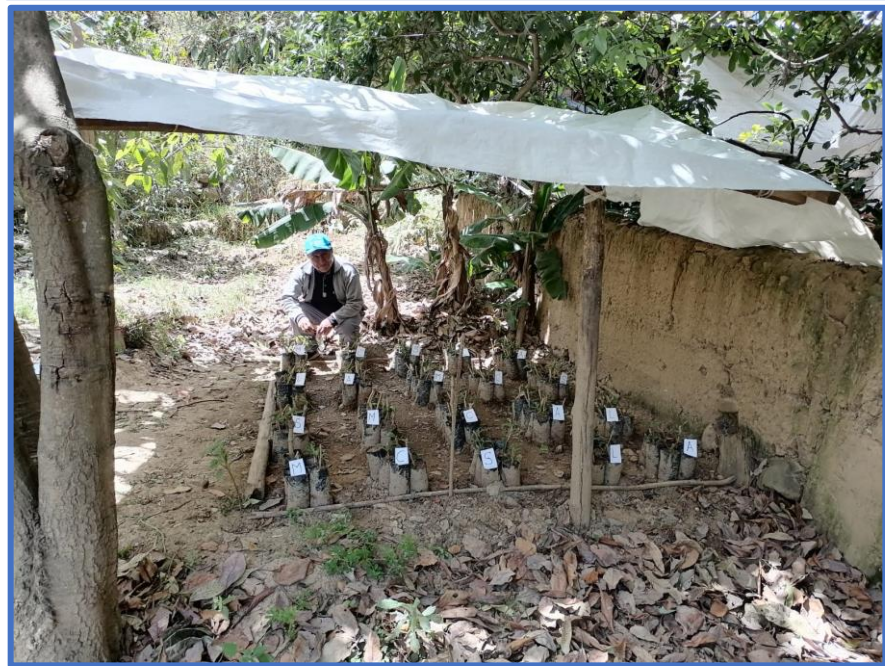
Vista del vivero con los 5 tratamientos distribuidos de acuerdo al croquis experimental.