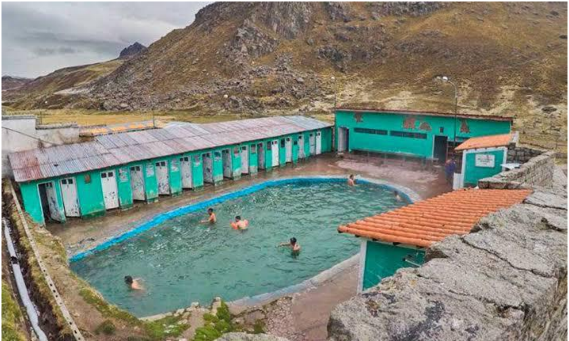
Los baños termales de calera