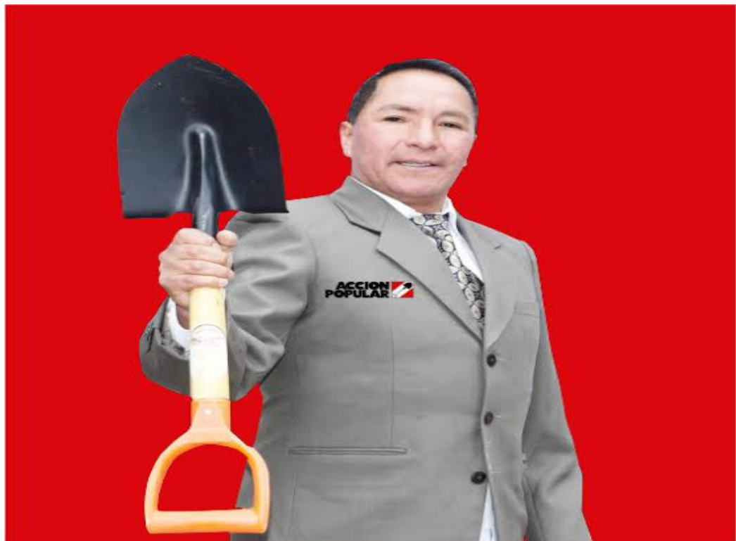
Alcalde de Huayllay