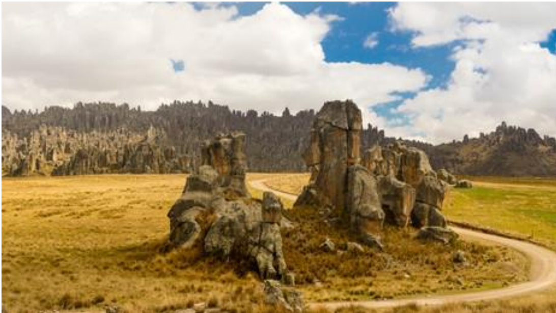
Camino al Bosque de Piedras de Huayllay