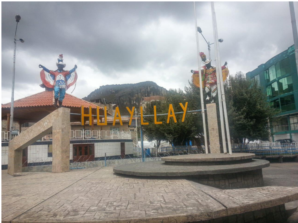
Plaza del distrito de Huayllay