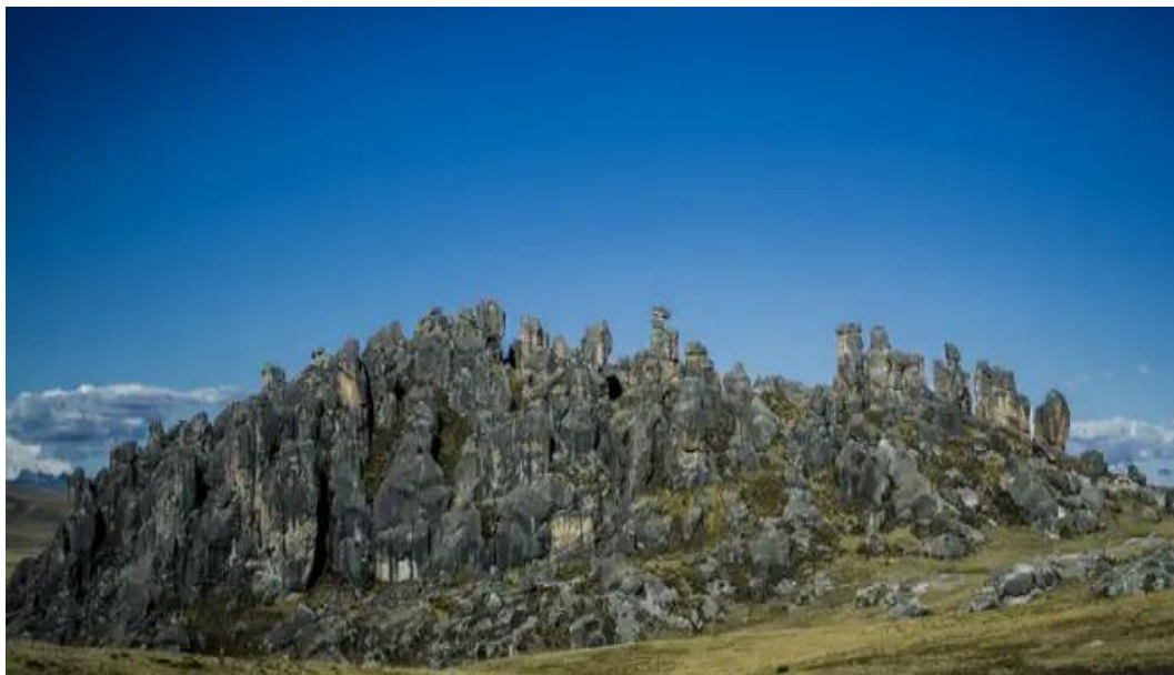
Cielo azul de Huayllay