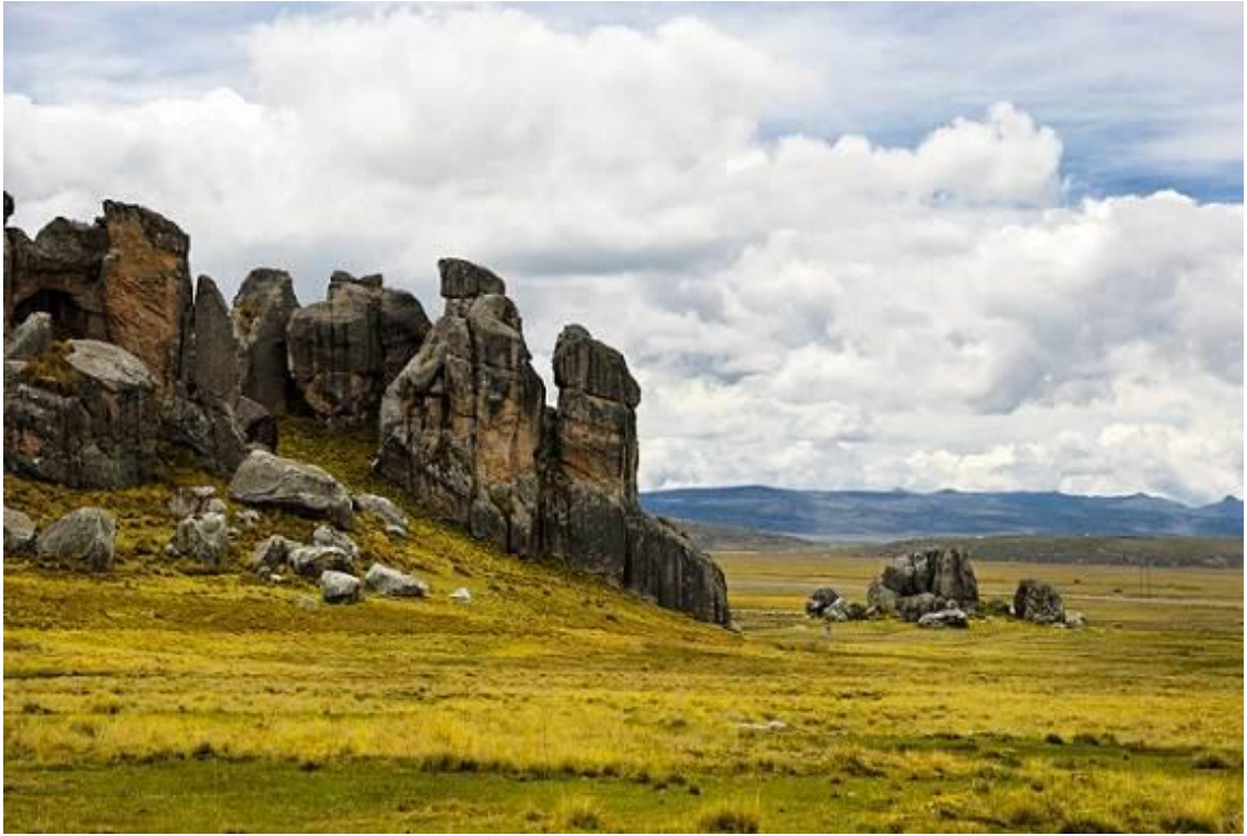
Campo del Bosque de Piedras