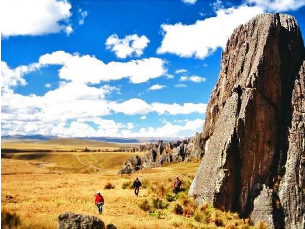
Cielo azul de Huayllay