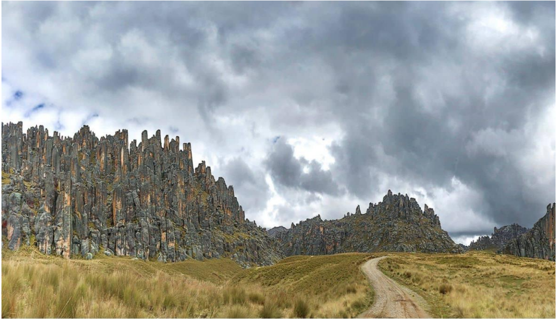
Camino al Bosque de Piedras de Huayllay