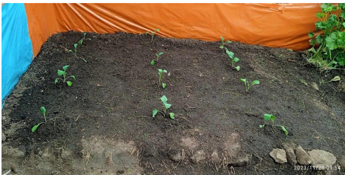
Fig 9 Vista de campo trasplantado