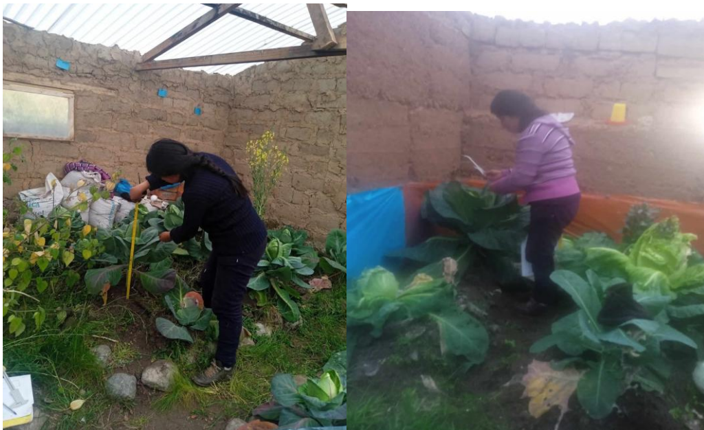
Fig 23 y 24 Cosecha de la col.