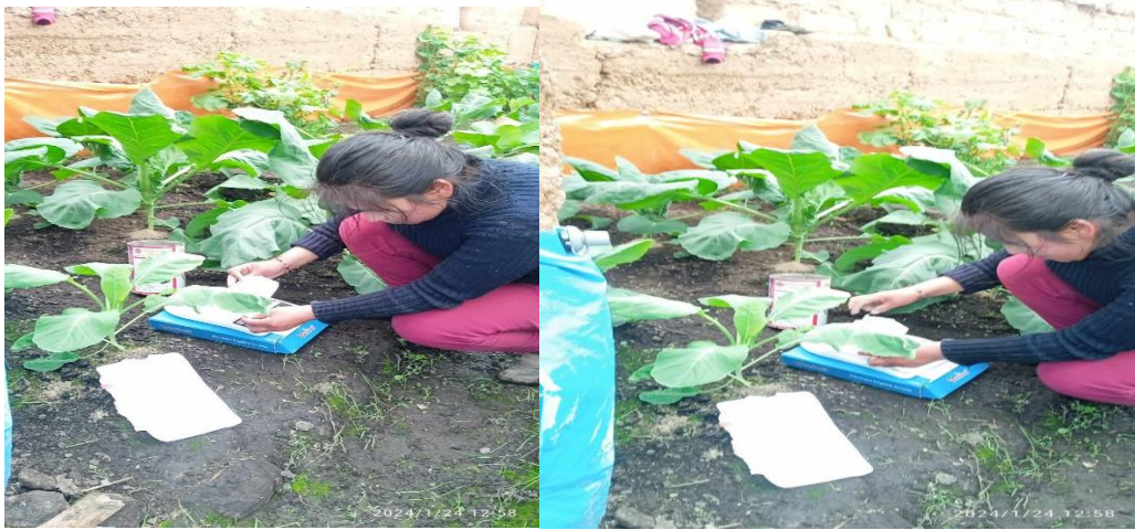
Fig 15 y 16 Evaluación de la col