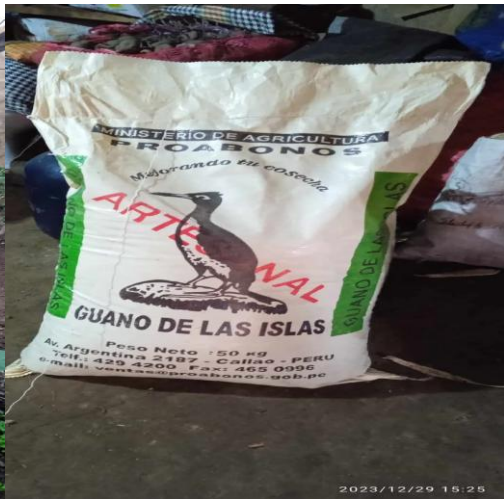
Fig 10 Riego de plantas de col Fig 11 Vista del guano de islas