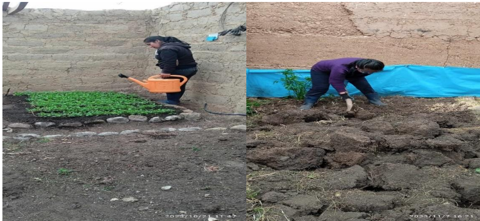
Fig 5 Riego de cama de almácigo Fig 6 Roturación de terreno para trasplante