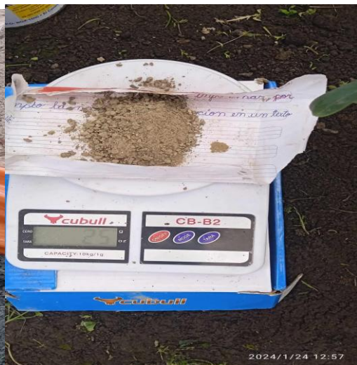
Fig 12 y 13 Vista de pesaje del guano de islas