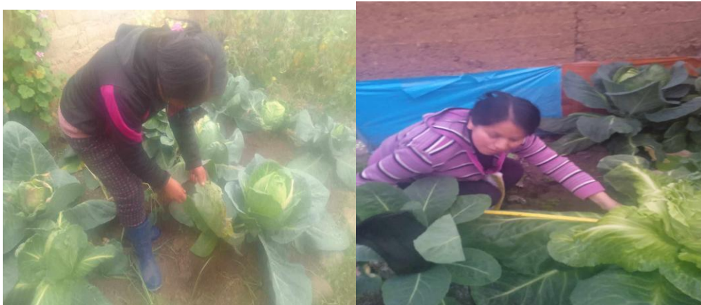
Fig 19 y 20 Evaluación de largo y ancho de las hojas de col