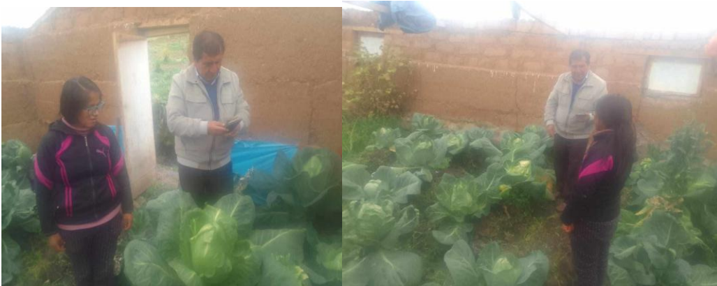
Fig 17 y 18 Visita del asesor del proyecto.