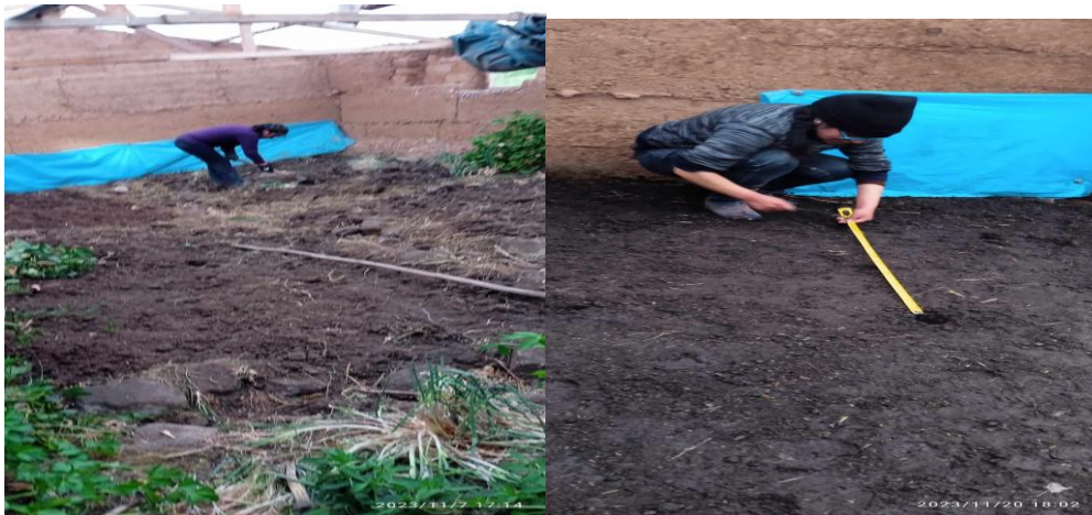
Fig 7 y 8 Trasplante de plántulas de col