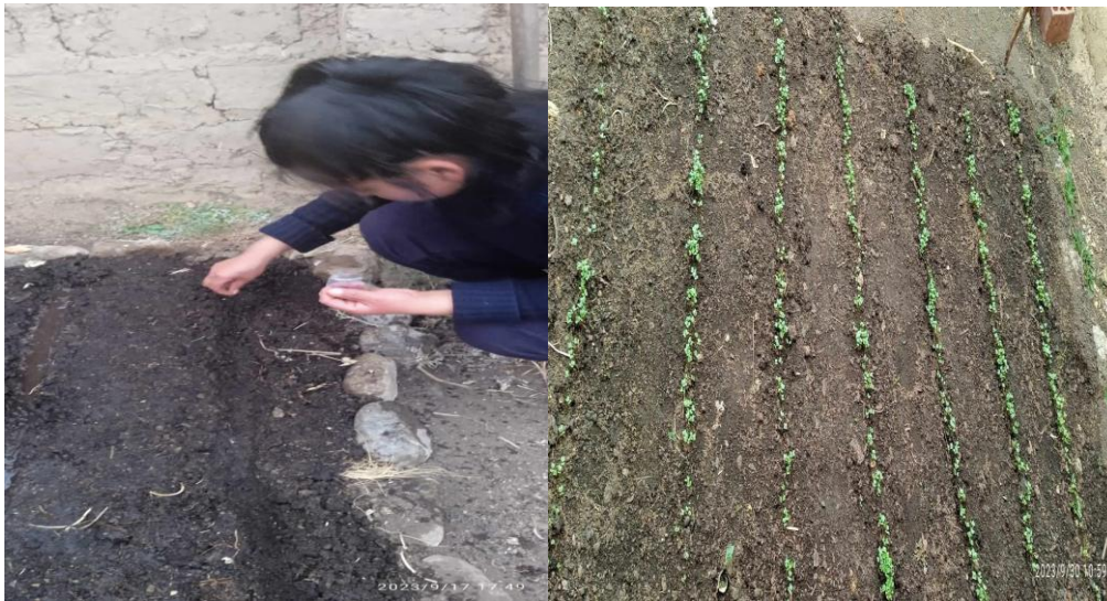
Fig 3 Siembra de cama de almácigo