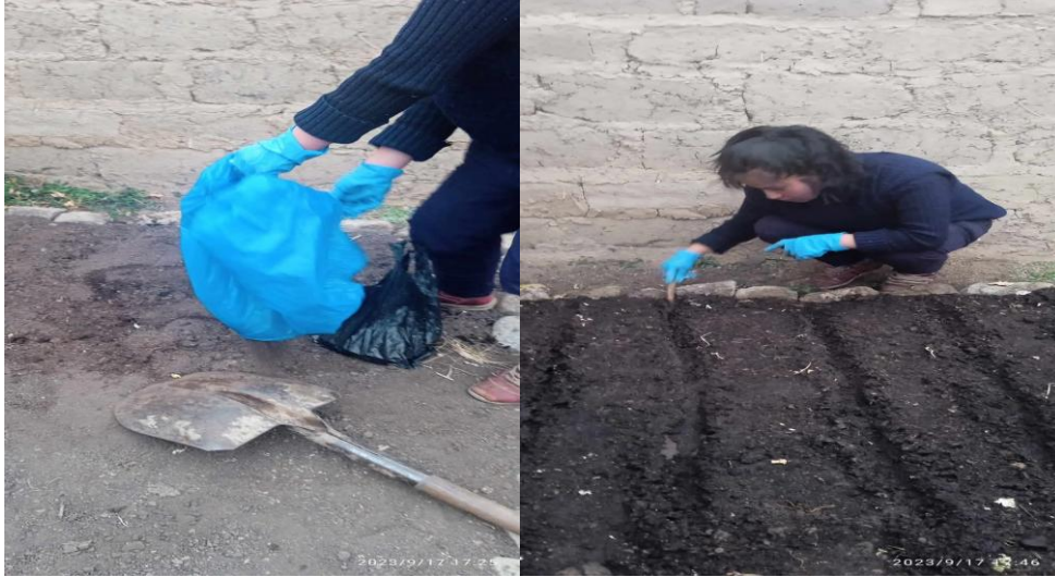
Fig 1 y 2 Preparación y trazado de surcos de cama de almácigo