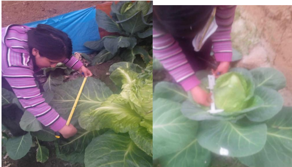
Fig 21 y 22 Vista de evaluación de la col