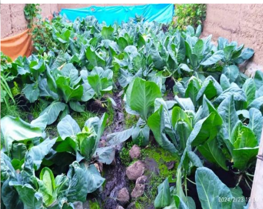
Fig 13 y 14 Vista de crecimiento de la col