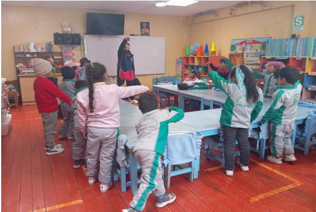
DESCRIPCION: Realizamos la dinámica "EL GUSANO", los niños realizan la dinámica con alegría y entonando la dinámica en eco.