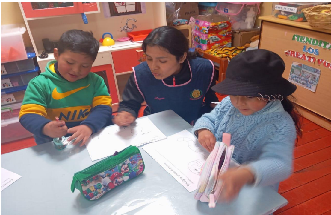
DESCRIPCION: Después de terminar la dinámica "EL GUSANO", los niños realizan la hoja con la consigna para pintar el gusano.