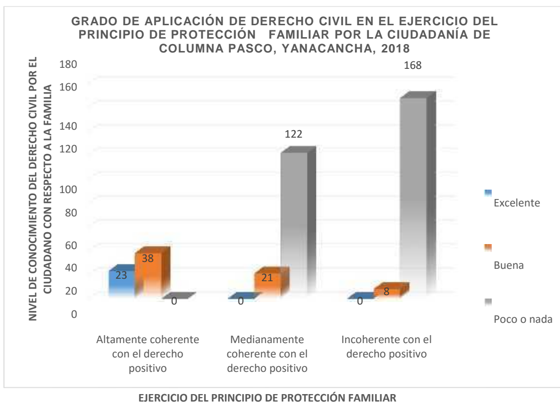
Gráfico N° 2

Interpretando el gráfico N° 2 muestra, que la diecisieteava parte de la ciudadanía de Columna Pasco – Yanacancha, 2018, con un Nivel excelente de Conocimiento del derecho civil con respecto a la familia es Altamente coherente con el derecho positivo en el Ejercicio del principio de protección familiar; la décima parte de la ciudadanía con un Nivel buena de Conocimiento del derecho civil con respecto a la familia es Altamente coherente con el derecho positivo en el Ejercicio del principio de protección familiar; la diecisieteava parte de la ciudadanía con un Nivel buena de Conocimiento del derecho civil con respecto a la familia es medianamente coherente con el derecho positivo en el Ejercicio del principio de protección familiar; y la cincuentava parte de la ciudadanía con un Nivel buena de Conocimiento del derecho civil con respecto a la familia es incoherente con el derecho positivo en el Ejercicio del principio de