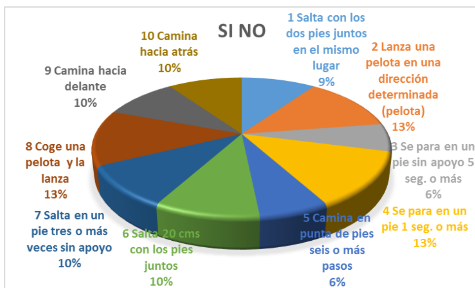
CUADRO 2 LISTA DE COTEJO POST TEST CARACTERISTICAS DE LA MOTRICIDAD GRUESA