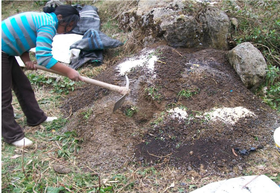
FIG 9 MEZCLA DE LAS DIFERENTES CAPAS