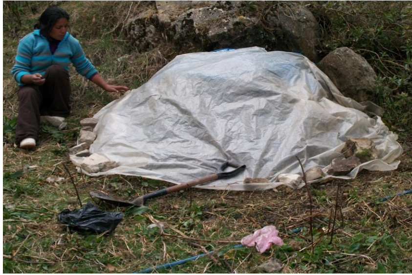
FIG 11 ESTADO FINAL DE LA PREPARACION DEL BOKASHI