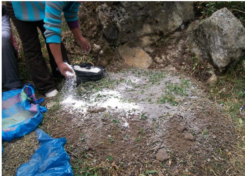
FIG 4. APLICACIÓN DE LA CAL