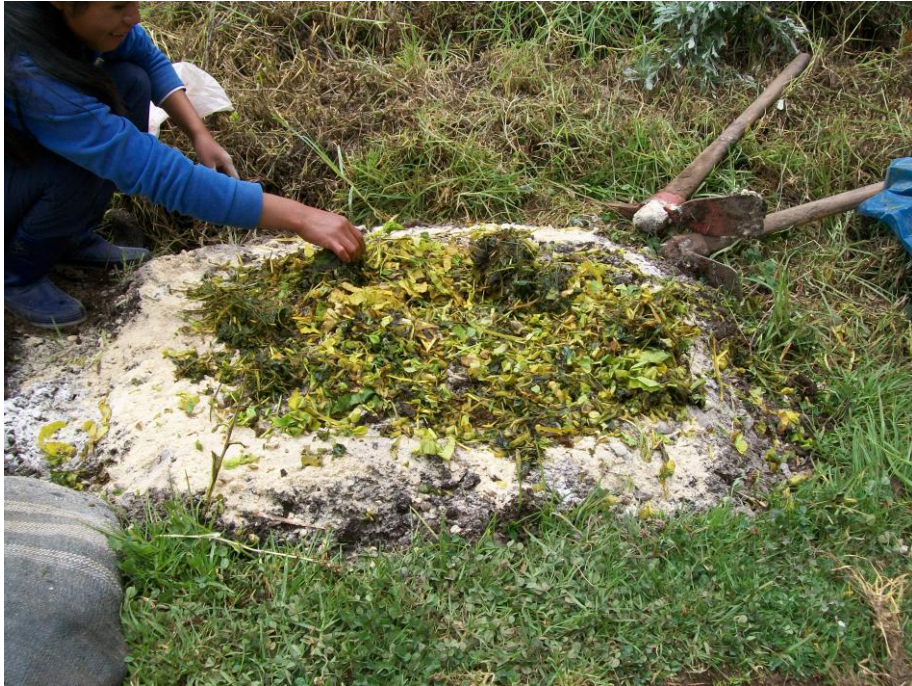
FIG 7 PRIMERA CAPA DEL BOKASHI