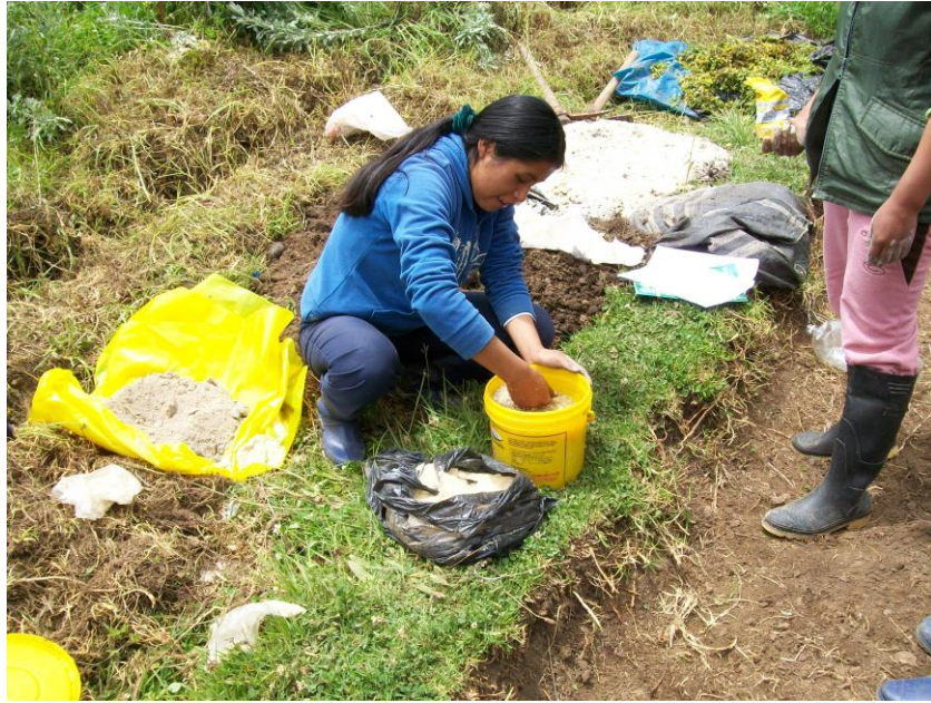
Fig 5. MEZCLA DE LOS INSUMOS PARA ELABORAR EL BOKASHI