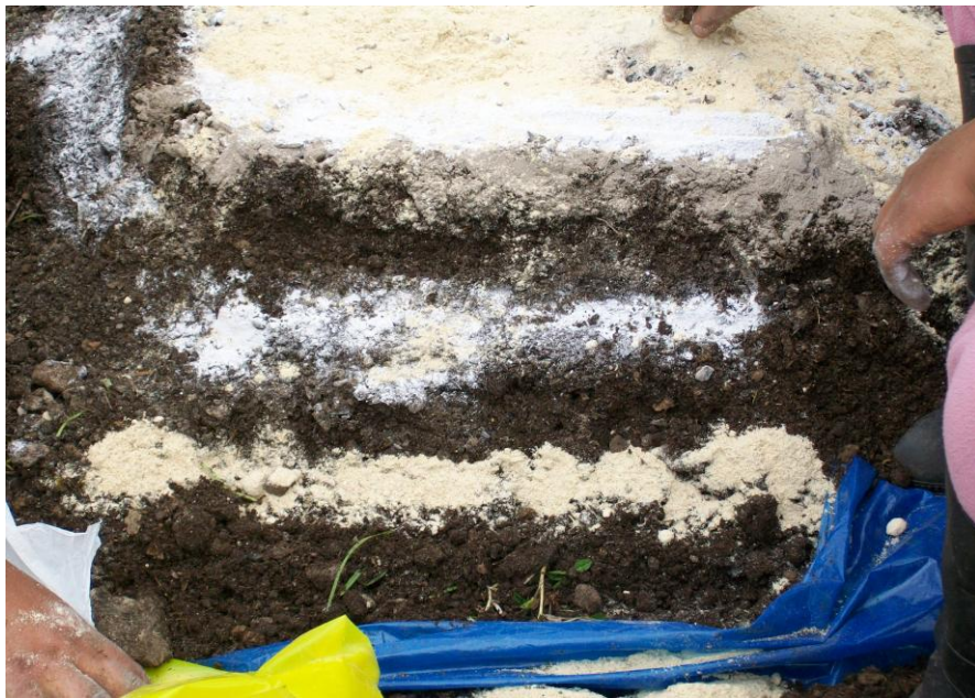
FIG 8. CONSTITUCION DE LAS CAPAS DE BOKASHI