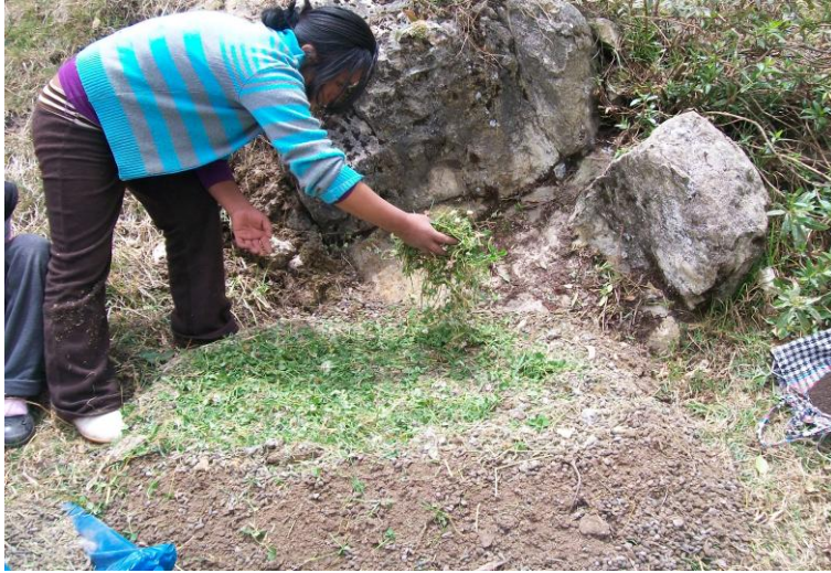
FIG 3. APLICACIÓN DE RESTOS VEGETALES PARA ELABORAR EL BOKASHI