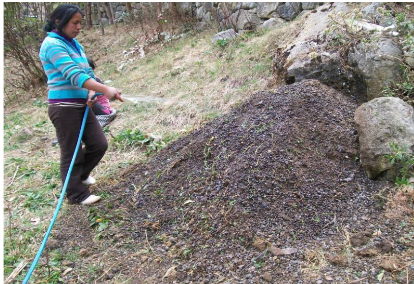
FIG 10 RIEGO PARA UNIFORMIZAR LAS CAPAS