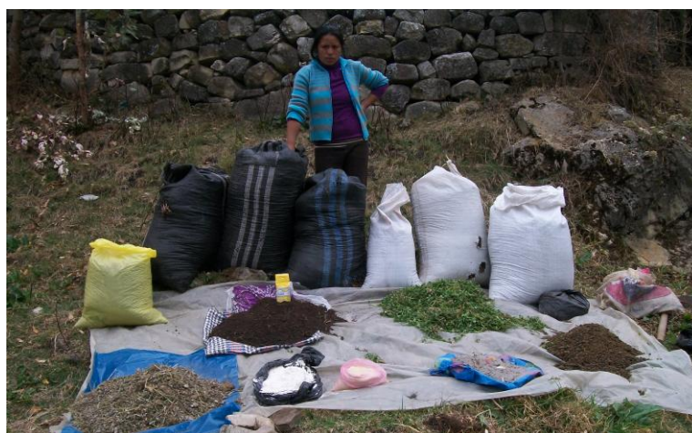
Fig 1 MATERIALES E INSUMOS PARA PREPARAR EL BOKASHI