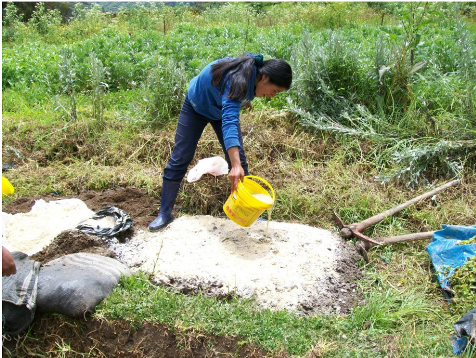
FIG 6. APLICACIÓN DE LOS INSUMOS LIQUIDOS