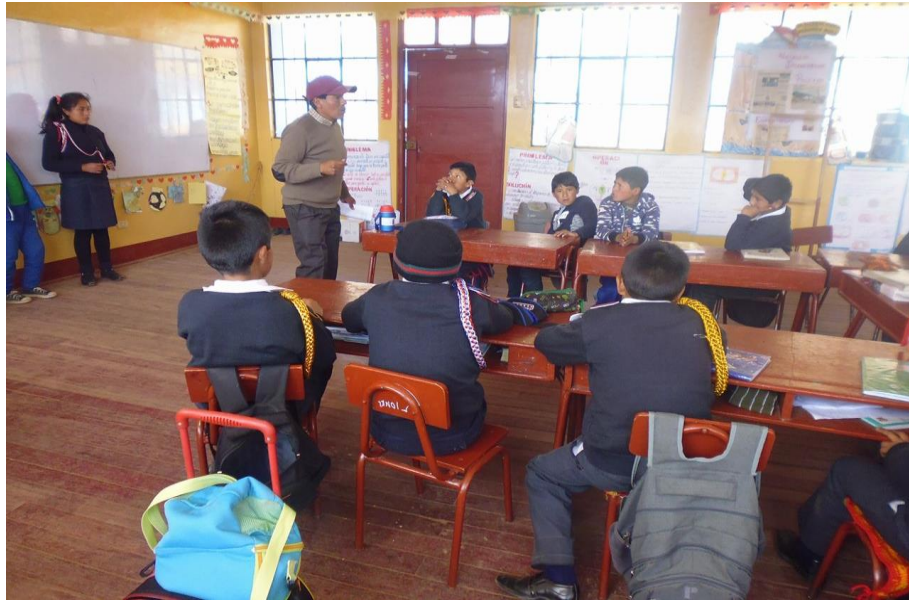
ESCUCHANDO NARRACIÓN DEL CUENTO LA CULEBRA Y EL SAPO