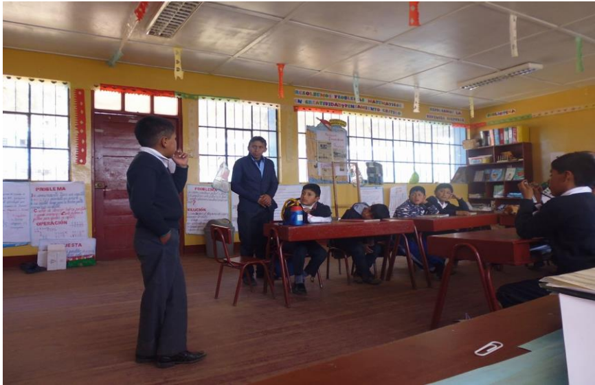
EN PLENO DESARROLLO DE ESTRATEGIAS DE EXPRESIÓN ORAL