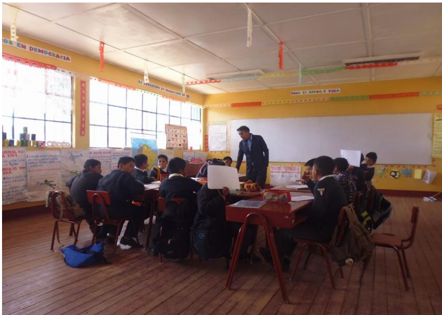
LUEGO DE HABER DESARROLLADO ESTRATEGIAS DE EXPRESIÓN ORAL CREANDO CUENTOS