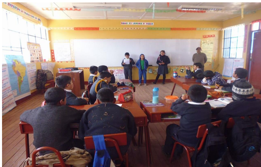
SOCIALIZAN LA PRODUCCIÓN DE TEXTOS COMO RESULTADO DE SU TRABAJO